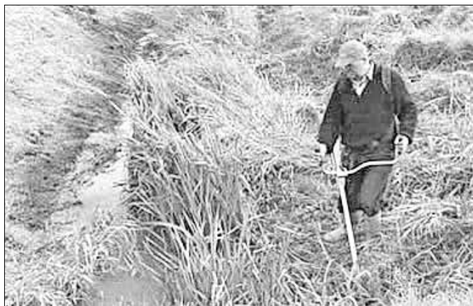
ZV Parthenaue Leipzig, Gewässerpflege

Anmeldung: bis zum 22.11.2013 per Anmeldebogen im Internet und formlos E-Mail: thume@pv-osterzgebirge.de , telefonisch 0351 27206610, per Fax 0351 27206613.