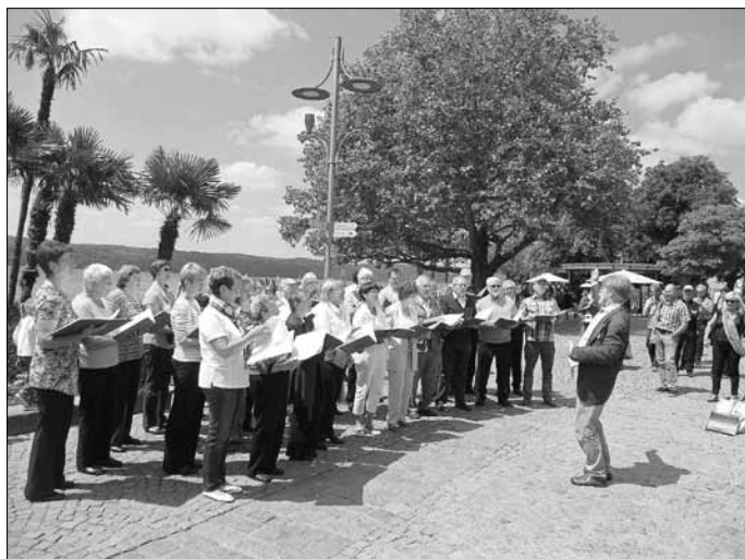
Chor Liederkranz Bad Schandau zum Straßensingen am Sonnabend, 30.05.2014

Als Teilnehmer des 3. Internationalen Chorfestivals führen wir am 29. Mai in unsere Partnerstadt Überlingen. Herzlich aufgenommen in unsere Gastfamilien, die uns für drei Nächte Quartier boten, wurde uns durch ihre freundliche und offene Art sofort jegliche anfängliche Skepsis und Unsicherheit genommen, wo wir denn untergebracht seien. Vom ersten Augenblick an fühlten wir uns wie „dr heeme“.