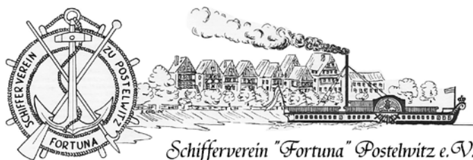
Schifferverein "Fortuna" Postelwitz e.V.