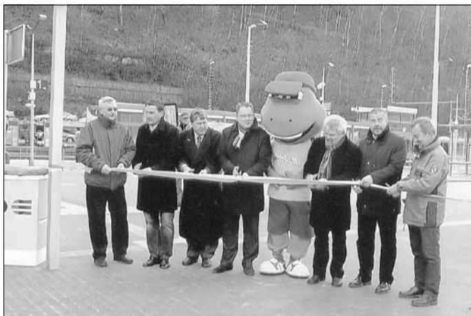
Feierliche Einweihung der Übergangsstelle

Allen voran steht der umfangreiche Bau der Übergangsstelle am Bahnhof mit all seinen Bestandteilen. Trotz langem Winter konnte das Vorhaben pünktlich und im geplanten Kostenrahmen fertig gestellt und feierlich übergeben werden.