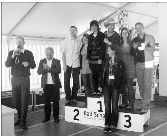
Dank an die Organisatoren des LINC-Treffens

Die ILE-Region hatte sich gemeinsam mit unserer Stadt für die Ausrichtung eines großen Treffens (LINC-Tagung) beworben. Ende April durften wir dann für mehrere Tage ca. 220 internationale Gäste aus 13 europäischen Ländlichen Entwicklungsregionen begrüßen. Die Tagungssprache war Englisch. Es wurde aber nicht nur getagt, auch sportliche Aktivitäten und Feiern standen auf der Tagesordnung. Die Vorbereitungen waren anstrengend, das Treffen ein Erfolg und gute Werbung für unsere Region und die Gäste waren begeistert und zufrieden.