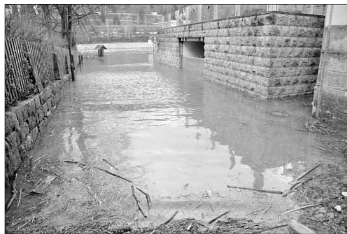
Hochwasser an der Dampfschiffstraße

Sehr geehrte Mitbürgerinnen und Mitbürger, „Erst am Ende eines Jahres weiß man, wie sein Anfang war.“ Dieses Zitat von Friedrich Nietzsche, dem eher pessimistisch eingestellten deutschen Philosophen ist aber von unschlagbarer Realität. Deshalb möchte ich für Sie, für uns gemeinsam einen kurzen, auszugsweisen Rückblick auf die vergangenen Monate werfen. Wie der Anfang des Jahres 2011 war, daran erinnern wir uns alle recht gut - es kam gleich mit Hochwasser daher, wo wir doch die Ereignisse des August und September 2010 noch gar nicht bewältigt hatten. Zum Glück blieb uns der Katastrophalarm knapp erspart, die Stadt, die Betriebe und viele Bürger hatten aber wieder Schäden und Ausfälle, die wir wahrlich nicht brauchen konnten. Dank gilt an dieser Stelle nochmals allen Einsatzkräften, Institutionen, freiwilligen Helfern, umsichtigen Bürgern und einigen Spendern für ihr Engagement und ihre Kraft.