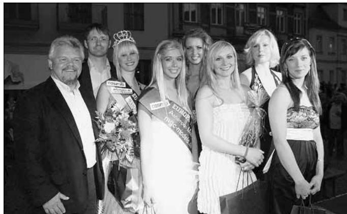
Bewerberinnen für Miss Bad Schandau

Das Thema Wandern als klassische sportliche Betätigung in unserer Region begleitete uns auch über das gesamte Jahr. Schon am 4. Januar fand als gemeinsame Veranstaltung des Bundesfinanzministeriums mit dem Tourismusverband Sächsische Schweiz e. V. die offizielle Präsentation der Sonderbriefmarke mit dem C.-D.-Friedrich-Motiv „Der Wanderer über dem Nebelmehr“ im Parkhotel Bad Schandau statt. Im April erfuhren wir, dass unsere Bewerbung zur Ausrichtung des 4. Sächsischen Wandertages 2012 erfolgreich war. Deshalb waren wir auch Gast und Aussteller beim 3. Wandertag in Markkleeberg und bekamen dort den Staffelstab überreicht. Der Malerwegtag im August führte auch mit einer Wanderung nach Bad Schandau. Das Stadtfest - die „ElbReise“, fand in diesem Jahr bereits Ende Mai statt und war wieder ein Höhepunkt im kulturellen Reigen. Diesmal gab es sogar eine Miss Bad Schandau - Wahl und die ehrgeizigen Bewerberinnen mussten sich einer kritischen Jury stellen. Vielfältige andere Angebote boten ein abwechslungsreiches Wochenende für Einheimische und Besucher.