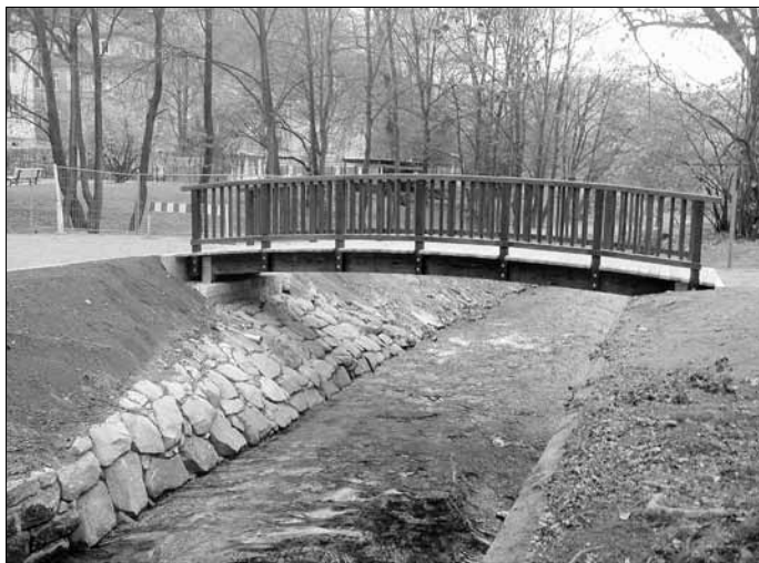
Neu errichtete Brücke im Stadtpark

An einigen Stellen gleichzeitig wurden Maßnahmen der Hochwasserschadensbeseitigung umgesetzt. Beispielhaft können wir hier die Stützmauer der Kirnitzsch am Café Memory, Zahngrund, Grenzgraben, Beräumung Graben Dekorahaus, Kriegerdenkmal und Brücke im Stadtpark an der Endhaltestelle der Kirnitzschalbahn nennen.