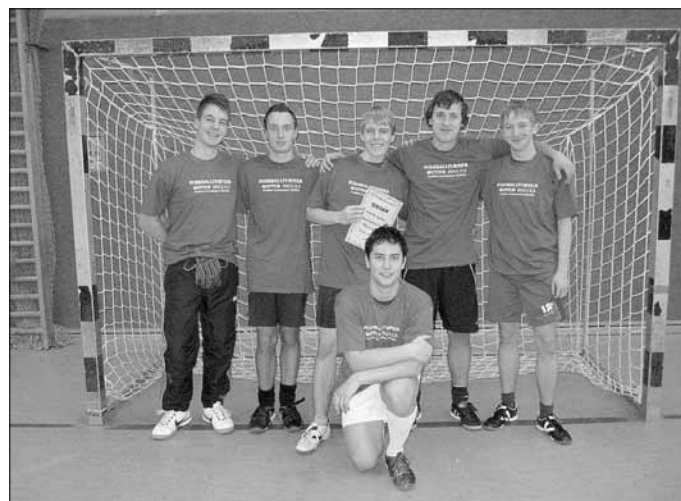
Siegermannschaft „Obergrenze B“