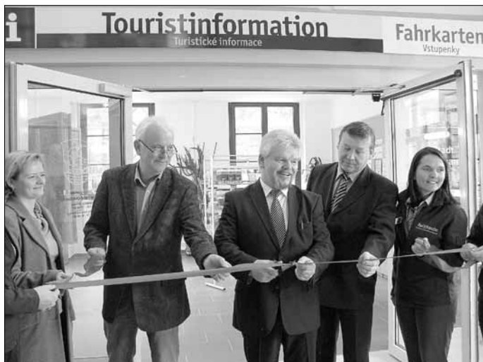
Übergabe Touristinfo im Bahnhof

Die ersten Monate standen wieder im Zeichen des Karnevals. Die Traditionsvereine gestalteten wieder mit Freude und Engagement hervorragende Umzüge und Prunksitzungen für jung und alt. Jubiläen konnten u. a. in Krippen und Schmilka begangen werden. Während uns der Winter noch voll im Griff hatte, wurde im Bahnhofsgebäude schon voll gewerkelt. Im Rahmen eines Ziel3-Förderprojektes wurden dort Toilettenanlagen und Touristbüro und -information umgebaut und saniert. Zu Saisonbeginn konnten die Einrichtungen auch feierlich übergeben werden und stehen Einwohnern, Bahnreisenden und allen Gästen zur Verfügung.