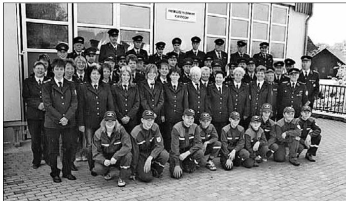
Freiwillige Feuerwehr Porschdorf am 18. Juni 2006

20:00 Uhr Tanzabend mit der „Rainbow-Disco.“ Sonnabend, 02.09.2006, ab 11:30 Uhr Essen aus der Feldküche, ab 14:00 Uhr Kaffeetrinken mit Selbstgebackenem, ... Preiskegeln für Kinder, ... Spiel und Spaß für Groß und Klein mit dem Spielmobil, 16:00 Uhr Einsatzübung-Verkehrsunfall gemeinsam mit den örtlichen Feuerwehren (Festwiese). Für die Schauübung bestellt Kam. Gotthard Hering einen Rettungswagen mit Besatzung und 2 Auto-Wracks.