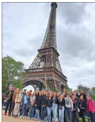
Das Wahrzeichen von Paris beeindruckte die Schüler Tag und Nacht