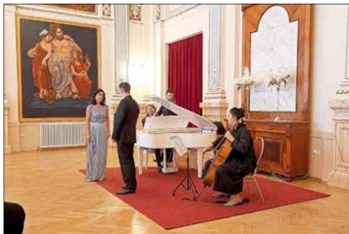
„Musik am Nachmittag“ im September 2022

Die Veranstaltung „Musik am Nachmittag“ findet am Sonntag, dem 19. März 2023, 14.00 Uhr im Parkhotel Bad Schandau unter dem Motto: