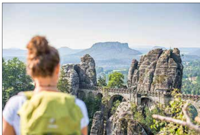
Tafelberge und Basteibrücke sind beliebte Wanderziele in der Sächsischen Schweiz

Die Sächsische Schweiz ist mit mehr als 200 Jahren Tourismusgeschichte nicht nur eines der ältesten Reiseziele in Deutschland. Es ist auch eine der facettenreichsten Wanderregionen der Republik: Mehr als 1200 Kilometer markierte Wege laden zu Streifzügen durch die wildromantische Erosionslandschaft unweit von Dresden! Das Spektrum reicht vom barrierefreien Spaziergang bis zum aufregenden Trekkingabenteuer mit Treppen, Leitern und Stiegen. Grenzüberschreitende Wege führen bis in die benachbarte Nationalparkregion der Böhmisches Schweiz.