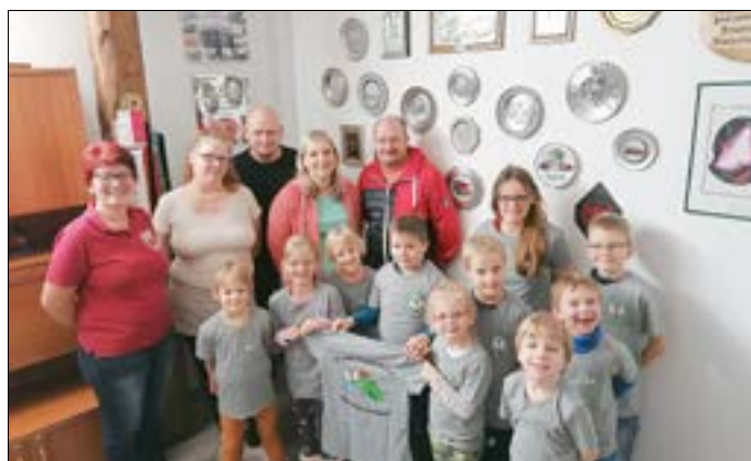
Die Kinder freuen sich über ihre neuen T-Shirts.

sind die Kinder der Kinderfeuerwehr Rathmannsdorf nun mit eigens für sie designten T-Shirts eingekleidet worden. Zu sehen ist ein auf unsere Kinderfeuerwehr zugeschnittenes Logo mit einem löschenden Drachen, verbunden mit dem Rathmannsdorfer Wappen. In diesem Zusammenhang durften die Kinder dem Drachen einen Namen geben. Nach vielen tollen Vorschlägen haben sie sich letztendlich auf den Namen „Drajo“ geeinigt.