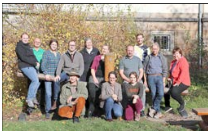
Mit dem Nationalparkzentrum wechseln auch dessen Mitarbeiterinnen und Mitarbeiter zur Nationalparkverwaltung.

Die Nationalparkverwaltung Sächsische Schweiz stellt das Informationsangebot für Gäste und Anwohnende neu auf: Seit dem Jahresbeginn ist das Nationalparkzentrum in Bad Schandau Teil der Nationalparkverwaltung von Sachsenforst. Damit wird der langjährige Prozess einer immer stärkeren Zusammenarbeit nun auch organisatorisch abgeschlossen. Mit dem vom Sächsischen Landtag beschlossenen Doppelhaushalt 2023/2024 wechseln die Bonnewitzer fünfzehn Mitarbeiterinnen und Mitarbeiter des sehr gut frequentierten Besucherinformationszentrums zu Sachsenforst. Seit der Gründung 2001 bis 2022 war das Nationalparkzentrum ein Fachbereich der Sächsischen Landesstiftung Natur und Umwelt (LaNU). Mit der Zusammenführung unter einem Dach sollen Aufgaben und Dienstleistungen gebündelt und effizient weiterentwickelt werden.